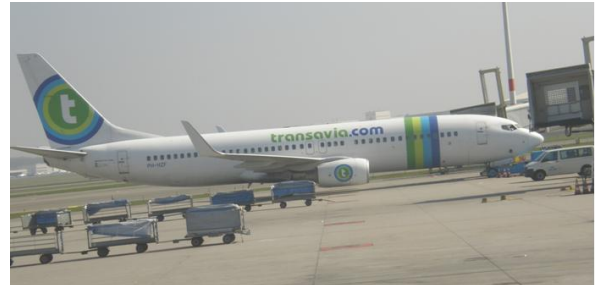
Vlucht HV 5135

Na een mooie vlucht kwamen wij op vrijdagmiddag aan in een zonovergoten Barcelona en gingen na een korte rustpauze in het hotel direct onze startnummers ophalen en restaurants regelen om later op de avond en de volgende dag goed te kunnen eten. De eerste avond werden wij uitstekend verzorgd in een Grieks restaurant en is er ontzettend veel gelachen.