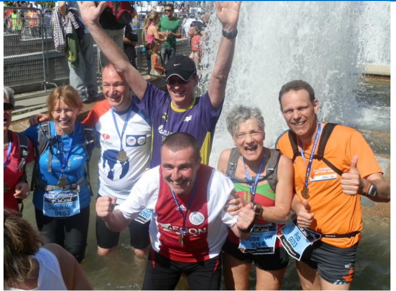
Afkoeling na een warme finish