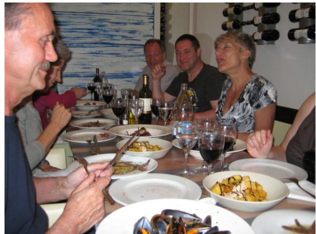
Echte spaanse tapas

De volgende dag zouden wij pas in de avond terugvliegen dus kon de dag nog volop benut worden. De groep wilde naar de Sagrada Familia van Gaudi maar daar aangekomen bleek er een enorme rij voor de kassa te staan waarop besloten werd een van de appartementen die Gaudi heeft ontworpen te bezoeken. In de middag was plaats gereserveerd in een tapasrestaurant waar wij ons enorm te buiten zijn gegaan aan wat de kok allemaal kon bereiden.