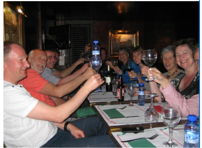
Meer gelachen dan gegeten

Dit keer in een Italiaans restaurant vanwege de grote behoefte aan pasta. Het contrast met de vorige avond kon niet groter zijn. Van de service en de menukaart klopte niets, wachten op elkaar zodat wij gezamenlijk konden eten had geen zin omdat het eten per bord en met grote tussenpozen naar boven werd gebracht. De ober was vast ook in training. Gelukkig konden wij er wel ontzettend om lachen en bleef de stemming goed.