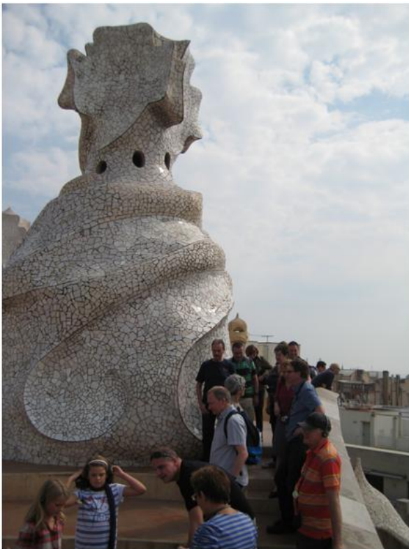
La Pedrera – Casa Milà