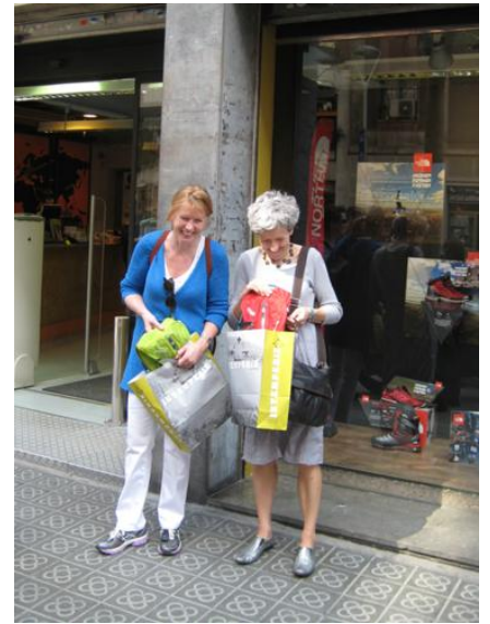
De Camelbak girls