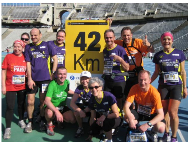
Olympisch Stadion op de Montjuïc

De volgende dag begon met een breakfastrun die bestond uit de laatste vier kilometers van de route van de Olympische marathon met als finish het Olympisch Stadion. Die marathonlopers van 1992 hebben het niet makkelijk gehad tijdens die laatste kilometers. Het was de beklimming van de Montjuïc!