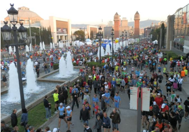
Voor de start