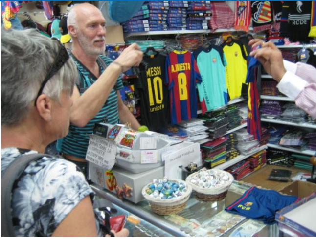
Voor Messi junior