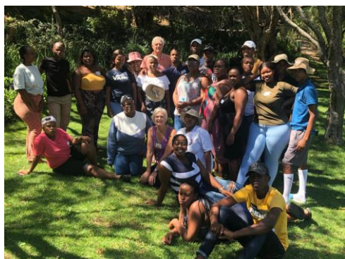
Groepsfoto: nieuwe jongeren 2022

De start van hun mentorjaar behelst training en empowerment. Een goed begin is het halve werk; de empowerment training support de jongeren door middel van meditatie, stevig lichaamswerk, spel, lezingen en een lange, lange wandeling in de heuvels van Wellington. Wellington ligt zo'n 100 km van Kaapstad.