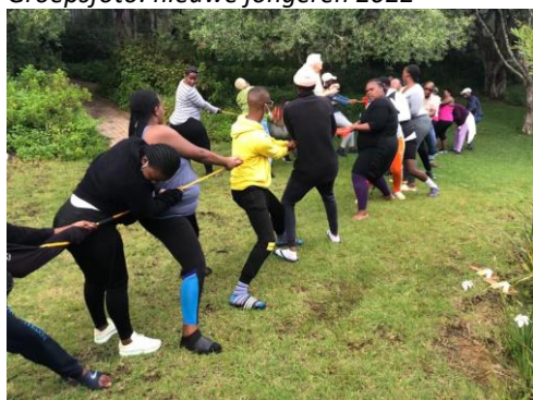
Je power voelen in touwtrekken