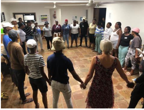
Afsluiting van de dag