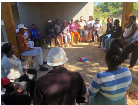
Mediteren nemen ze 'mee naar huis'